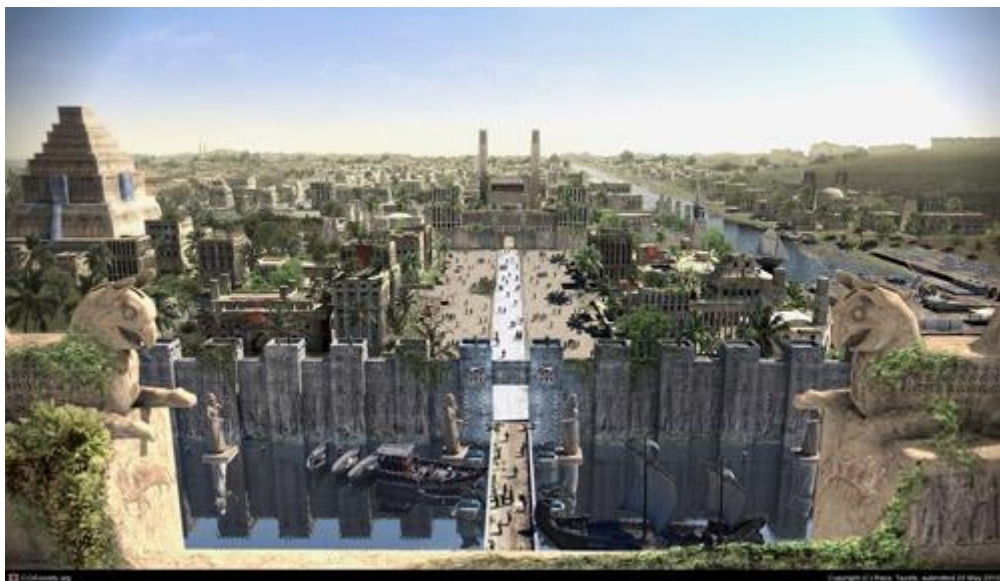
نگاره‌ای خیالی از شکوه بابل در دوران باستان