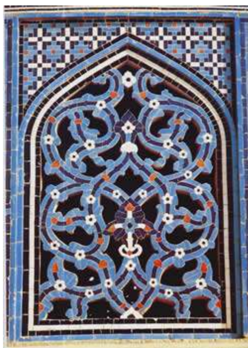
p کاشی معرق - پنجره مشبک کاری مسجد شیخ لطف الله اصفهان

با نزدیک شدن به قرن هشتم هجری، آبی لاجوردی از رواج و محبوبیت بیشتری برخوردار شد و سرانجام تکنیک نقاشی زیر لعاب با استفاده از رنگهای آبی لاجوردی و اندک مایه ای از رنگهای قرمز و سیاه، جایگزین نقاشی زرین فام شد که کاشی های تولید شده با چنین تکنیکی معمولاً با نام کاشی های سلطان آباد شناخته می شوند. این تکنیک تا اواسط قرن هشتم مورد استفاده قرار می گرفت و پس از آن منسوخ شد.