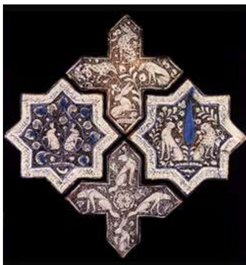
p کاشی های هشت پر ستاره ای و چلیپا - قرن هفتم هجری - امامزاده جعفر دامغان

لعاب زرین فام که ابوالقاسم آن را دو آتشفشان خواند، رایج ترین و معروف ترین تکنیک در تزئینات کاشی بود. این تکنیک ابتدا در قرن دوم هجری در مصر برای تزئین شیشه مورد