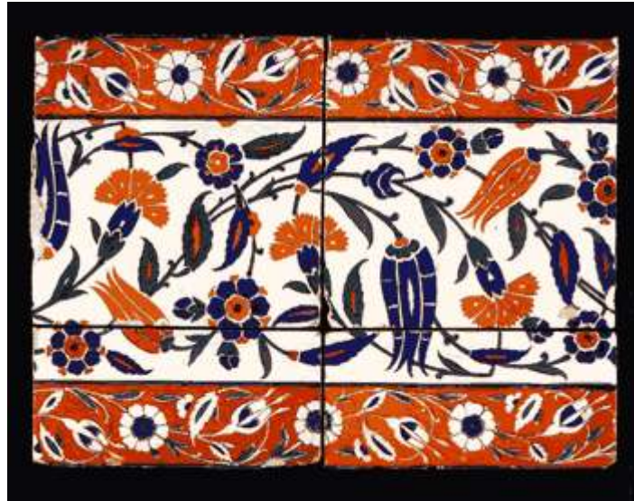
p کاشی ایزنیک - قرن پنجم هجری - ترکیه

در قرن دهم هجری، ایزنیک مرکز تولید ظروف سفالی و کاشی در ترکیه محسوب می شد. یک رنگ قرمز درخشان جدید و یک دوغاب غنی شده از آهن به صورت ضخیم غیر قابل نفوذ به زیر لعاب، به کار گرفته می شده که از ویژگی های کاشی ایزنیک به شمار می آمد. یک سبک برگدار زیبا با طراحی های واقعی از گل های لاله، سنبل و میخک نیز بر روی کاشی ها، منسوجات، جلدسازی و سایر هنرهای ترکیه قرن دهم مورد استفاده قرار گرفتند اما پس از قرن یازدهم هجری، کیفیت کاشی ایزنیکی رو به افول گذاشت و از این دوران به بعد، ساخت کاشی در شهر کوتاهایا در مرز فلات آناتولی ادامه یافت.