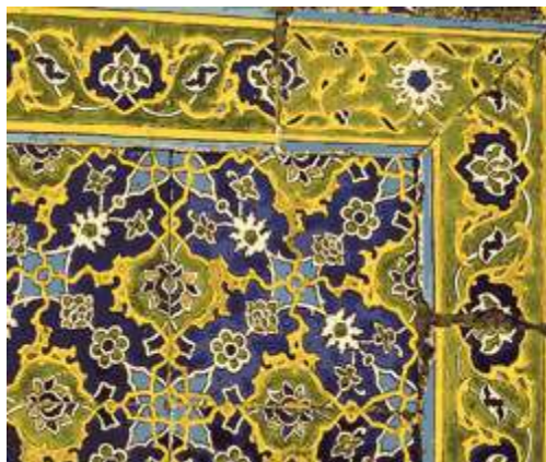
p کاشی هفت رنگ - قرن دهم هجری - ترکیه

یکدیگر جدا می شدند. در بسیاری از بنا های تیموریان شاهر رواج مجدد کاشی کاری به شیوه هفت رنگ هستیم که به عنوان نمونه، می توان از مدرسه غیاثیه خردگرد که در سال ۸۴۶ ه.ق تکمیل شده یاد کرد.