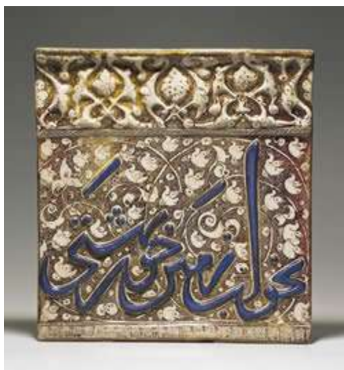
p کاشی زرین فام - قرن پنجم هجری - کاشان