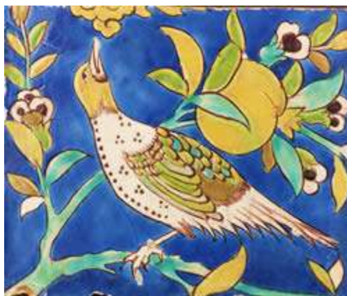
p کاشی هفت رنگ - قرن هشتم هجری - ایران

ساجد و مدارس صفویه به طور کلی با پوششی از کاشی ها در درون و بیرون بنا تزیین شده اند. در حالیکه کاربرد کاشی های معرق تداوم می یافت، شاه عباس که برای دیدن بناهای