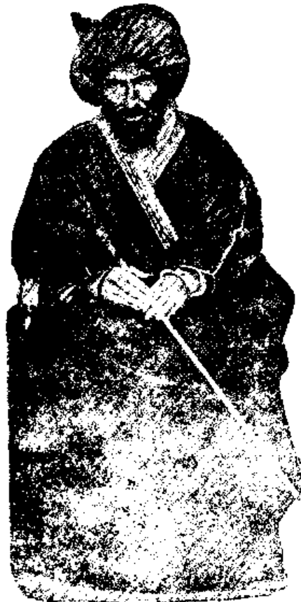
حاجی محمد کریمخان کرمانی بنیاد گزار کریمخانگیری (از روی پیکره ای که در دست آقای مصور رحمانیست برداشته شده)

در هنگامیکه اینان هر کدام دسته ای پدید میآورد، سیدی در شیراز بنام میرزا علی محمد بدعوی برخاسته و گروهی از ملایان شیخی نیز به او گرویده بودند و یکدسته بزرگتری از آنرا پدید میآمد. ولی ما چون از بایگیری جداگانه سخن خواهیم راند، در اینجا بآن نمیپردازیم. در اینجا داستان شیخان و کریمخانان را بکوتاهی پایان میرسانیم: