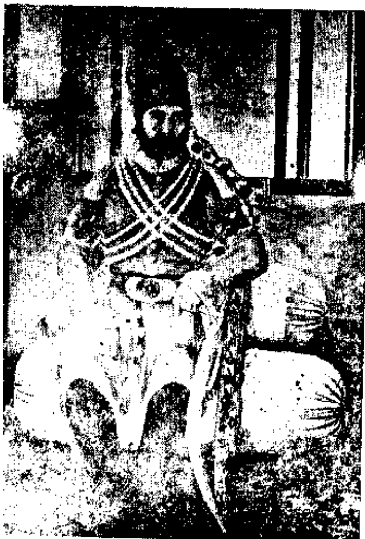
محمدشاه که بایگیری از زمان او آغاز گردیده

بعضهم لبعض ظهیرا چه رسد بقرآن آن نادان که بجای کهیصص مثلا کاف، ها، جیم، دال، نوشته و بدین نمط مزخرفات و اباطیل ترتیب داده. بلی، حقیقت احوال او را من بهتر میدانم که چون اکثر این طایفه شیخی را مداومت به چرس و بنگ است جمیع گفته ها و کرده های او از روی نشئه حشیش است که آن بدکیش به این خیالات باطل افتاده و من فکری که برای سیاست او کرده ام اینست که او را بماکو فرستم که در قلعه ماکو حبس موبد باشد. اما کسانی که به او گرویده اند و متابعت کرده اند، مقصرنند. شما چند نفر از تابعین او را پیدا کرده بمن نشان بدهید تا آنها مورد تنبیه و سیاست شوند. باقی ایام فضل و افاضت مستدام باد. 1