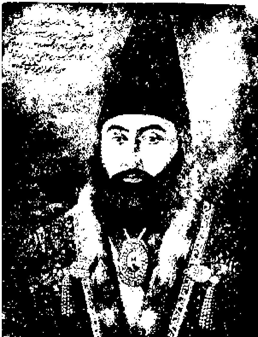
امیر کبیر که دستور کشتن باب و پیروان او را داده.

باب یکسال پیش از کشته شدن بمیرزا یحیی نوری که در میان بابیان لقب ازل میداشت و خود جوان هیجده ساله ای میبود، نامه نوشته و او را بجانشینی از خود برگزیده بود. پس از کشته شدن باب، اندک گفتگویی درباره جانشینی او پدید آمد. ولی زود پایان پذیرفته همگی به ازل گردن گزاردند.