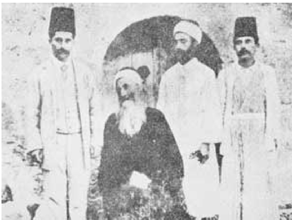
میرزا یحیی نوری (ازل)

این داستان یکی از افسوس آورترین و دلسوزترین پیشامدهای تاریخ ایرانست و میباید خستوان بود که دژرفتاری بیش از اندازه رخ داده. کنت گوینو سفیر فرانسه که اینزمان در تهران میبوده و اینداستان را با هنایندترین زبانی در کتاب خود نوشته و بچاپ رسانیده، همین نوشته ها نتیجه آنرا داده که اروپاییان بایان را شناخته و درباره ایشان خوش گمانی بیش از اندازه پیدا کرده اند. اینداستان را در نسخ التواریخ بدرازی نوشته و ما چون خواستمان نوشتن تاریخ پیشامدها نیست، بکوتهای یاد نموده دنباله سخنان خود را خواهیم گرفت.