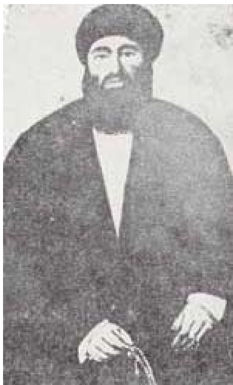
سید کاظم رشتی

بهرحال آن گفته شیخ درباره امام ناپیدا و این دعوی‌ش درباره جانشینی یا دری، سرمایه ای برای سید علی محمد باب گردیده (چنانکه کمی پایین تر خواهیم دید).