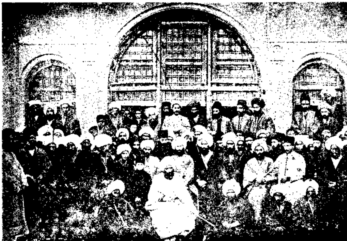
این پیکره گویا در چهل و چند سال پیش در کرمان برداشته شده و حاجی محمدخان پسر حاجی محمد کریمخان و جانشین او (رکن رابع آزمان) را با خویشان و پیروانش نشان میدهد.

حاجی میرزا شفیع و همراهان او بروی گفته های شیخ احمد و سید کاظم ایستادگی نموده چیزی بآن نمیافزودند. ولی کریمخان که خود را کمتر از شیخ و سید نمیشناخت، کتابهای بسیاری نوشته و بسخان نوینی میپرداخت. چنانکه شیخ احمد به گزافگوییهای شیعیگری خرسندی ننموده، خود گزافه های دیگری بآنها افزوده بود، کریمخان نیز به گزافگوییهای شیخ و سید خرسندی ننموده و خود او در گزافگوییها گامهای بسیاری پیش رفته: «جانشینی ویژه» (نیابت خاصه) از امام زمان که شیخ و سید نیمه نهران و نیمه آشکار دعوی کرده بودند، این در کتابهای خود رویه رسمی بآن داده و چنین گفته: چنانکه میانه مردم با خدا بمیانجی نیاز است (که پیغمبر باشد)، میان امام زمان و مردم نیز بیک میانجی نیاز میباشد. اینست باید در هر زمان چنین کسی باشد. گاهی مثل آورده چنین گفته: چنانکه هر خانه ای به چهار پایه (رکن) نیازمند است، جهان نیز چهار پایه میخواهد: (۱) خدا، (۲) پیغمبر، (۳) امام، (۴) جانشین ویژه امام. اینست در زبان آنان جانشین ویژه «رکن رابع» یا (پایه چهارم) نامیده شده. سخنان پوچ دیگری نیز از او سر زده که در اینجا بگفتگو از آنها نیازی نیست. راستی را کریمخان نیز بافنده استادی میبوده اگرچه پپای سید کاظم نمیرسیده.