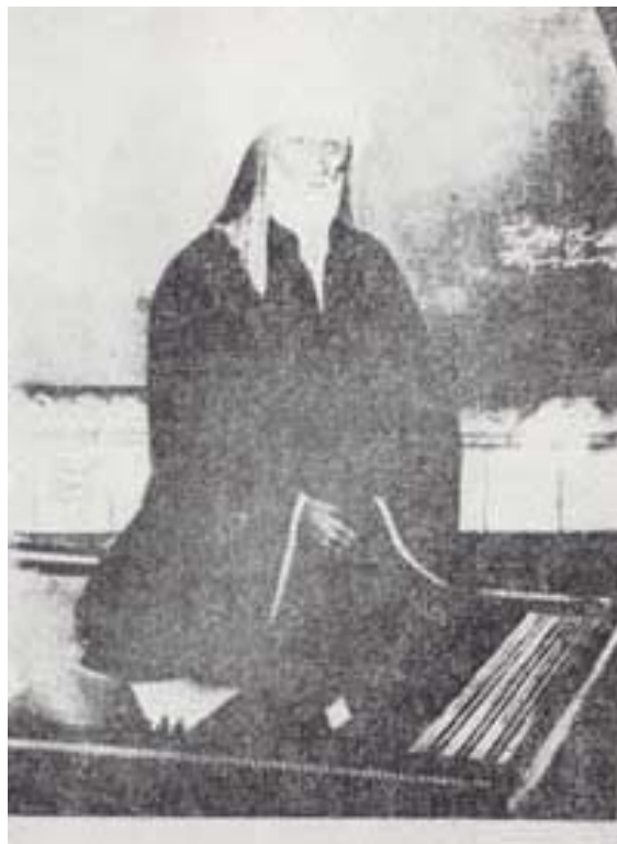
شیخ احمد احسائی

شیخگیری را شیخ احمد احسائی بنیاد گزارده. این مرد در زمان فتحعلیشاه در کربلا زیسته، چون پارسایی بسیار از خود نشان میداد و خود مرد تیزهوش و زبانداری میبود و شاگردان بسیاری بگرد سر میداشت، در ایران و عراق و جنوب عربستان بسیار شناخته شده یکی از علمای بزرگ آن زمان بشمار میرفت. چنانکه چون به ایران سفر کرد، فتحعلیشاه و پسرانش پیشواز و پذیرایی نیکی به او نمودند.